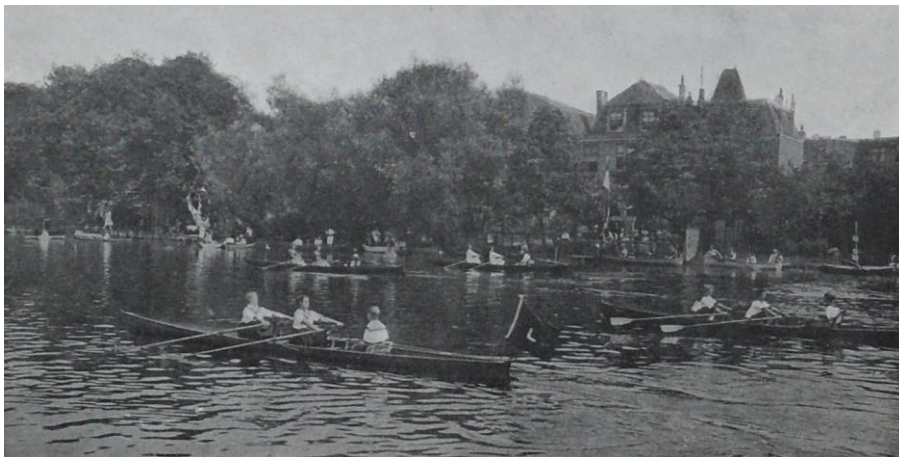
Bij de Roeidag op zaterdag 5 juli 1919, ter viering van het eerste lustrum, mochten de dames haar 'krachten' uiteraard slechts meten met stijlroeien, op deze foto in vierriems tubs.

Wie de situatie bij Die Leythe bestudeert, kan zich niet aan de indruk onttrekken, dat ook daar, tot de "paleisrevolutie" van 1935, paternalistische opvattingen heersten over de andere helft van de mensheid. Het lijkt, dat de dames zich slechts elegant over het water mochten voortbewegen, hetzij als stuurvrouw in een wherry, geroeid door één of twee heren, hetzij "stijlroeiend" (ook wel "schoonroeiend") met een damesploeg in wherry, tub of vier. Vrouwen mochten niet raceroeien, omdat algemeen werd gevreesd, dat de daarmee gepaard gaande inspanningen desastreus zouden zijn voor haar vermogen kinderen te krijgen. Op de desbetreffende enquête van de Nederlandsche Roeibond (april 1929) vulde het Bestuur dan ook in tegen het wedstrijdroeien door dames te zijn "op medische gronden". Voorzitter van Die Leythe was nota bene de arts dr C.J.A. van Iterson - nu ja, KNO-arts, maar toch iemand van wie men ter zake enige expertise mocht verwachten.