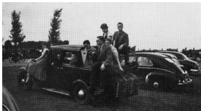
Links: Bij de EK, op 22 augustus 1954 op de Bosbaan, moest de damesvier alleen in de CCCP-ploeg haar meerdere erkennen. Rechts: Aan morele steun ontbrak het niet: Leythe-supporters in 1954 langs de Bosbaan.