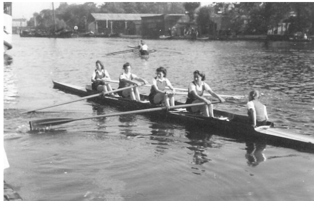
De jaarlijkse WRB-wedstrijden werden op 4 oktober 1942 verroeid op het Galgewater. De beide Leythse damesvieren; links de wedstrijd van de stijlviere; rechts de winnende stijlvier; het woonschip aan de Morskade hing gevaarlijk scheef.