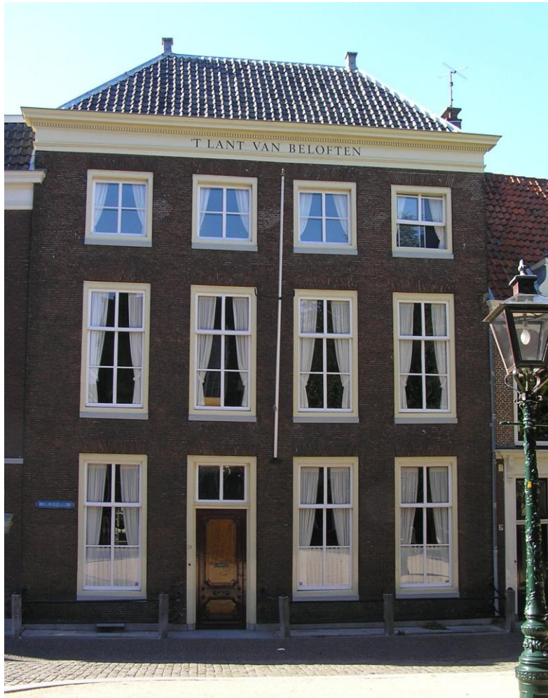
Hooglandse Kerkgracht 29, 'T LANT VAN BELOFTEN.